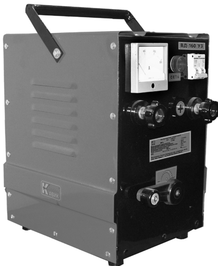
Рис 1. Общий вид выпрямителя

1.4. Не допускается использование выпрямителя для работы в среде насыщенной пылью, во взрывоопасной среде, а также в среде, содержащей едкие пары и газы, разрушающие металлы и изоляцию.